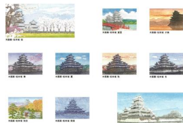
松本城の日記念切手